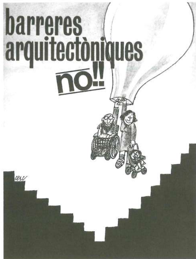
Cartel editado en 1983.

Desde el Institut siempre se ha promovido que las personas con movilidad reducida puedan disfrutar de la ciudad, igual que el resto de los ciudadanos y ciudadanas. Pero además cuando se hace una mejora en la accesibilidad para estas personas (personas con disminución que se