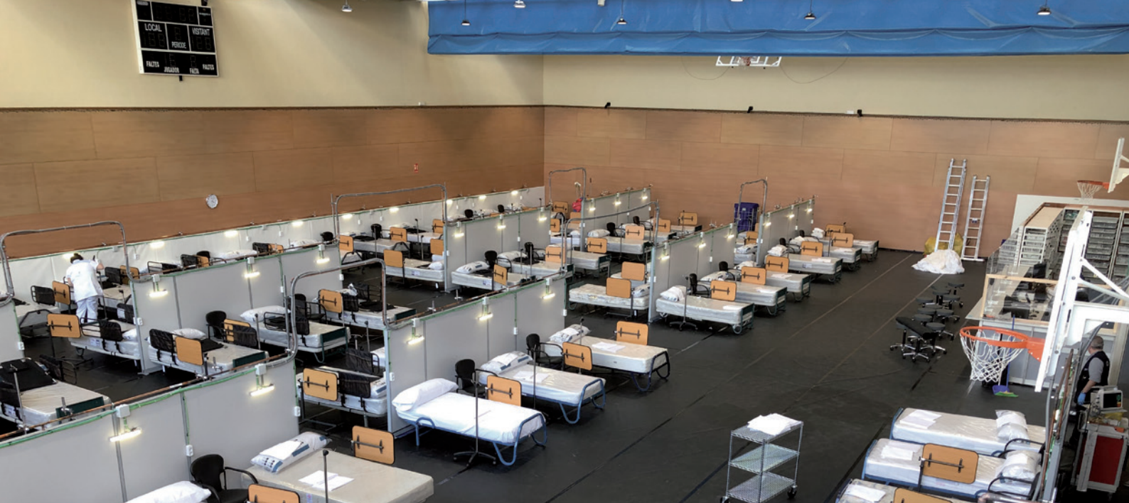
ABRIL: Inauguración del Hospital de Campaña en el pabellón polideportivo.