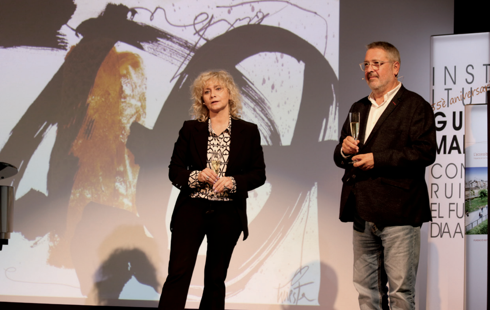
NOVIEMBRE: 55 aniversario del Institut Guttmann. Presentación del proyecto de investigación social PARTICIPA y del tercer volumen de Innovación Social y Discapacidad “La accesibilidad como motor de cambio social”.