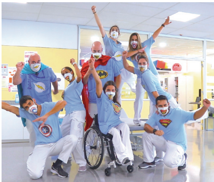
SEPTIEMBRE: Recuperamos la rehabilitación ambulatoria pediátrica.