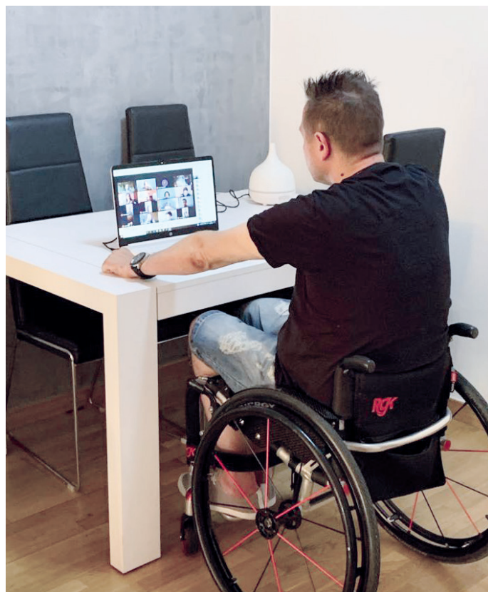
OCTUBRE: Inicio de la campaña telemática de prevención de accidentes de tráfico “Game Over”, con más de 300 sesiones en línea en los colegios.