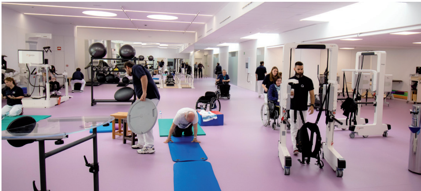
ENERO: Celebración del primer aniversario de la inauguración de Guttman Barcelona.