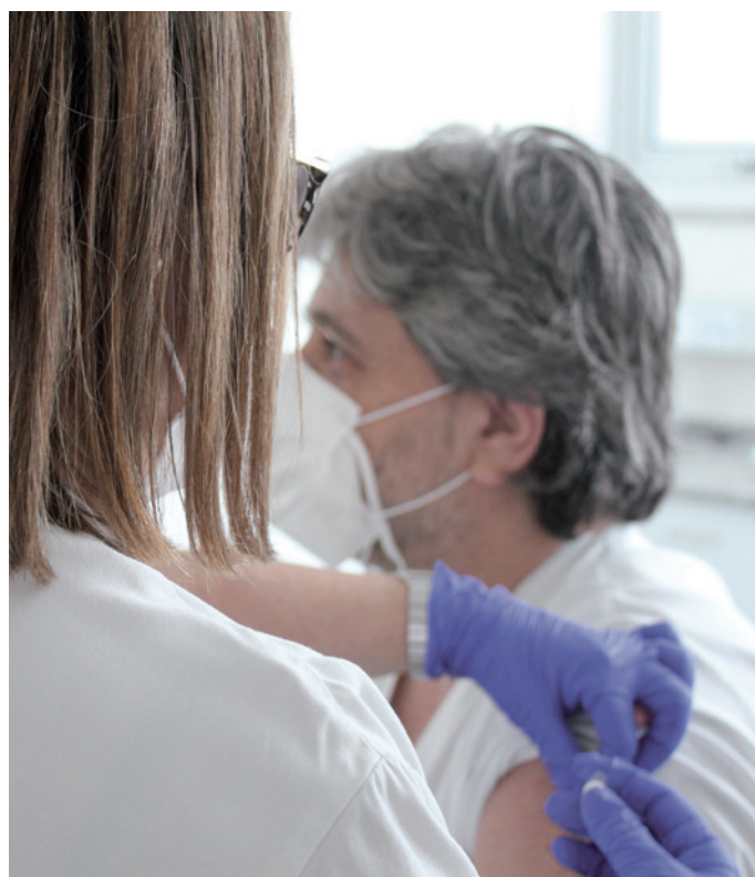
ENERO 2021: Inicio de la campaña de vacunación.