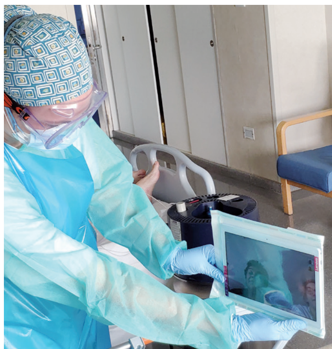
MARZO: Declaración del estado de alarma y habilitación de dos unidades con 70 camas para la atención a pacientes covid. Cierre temporal de Guttman Barcelona.