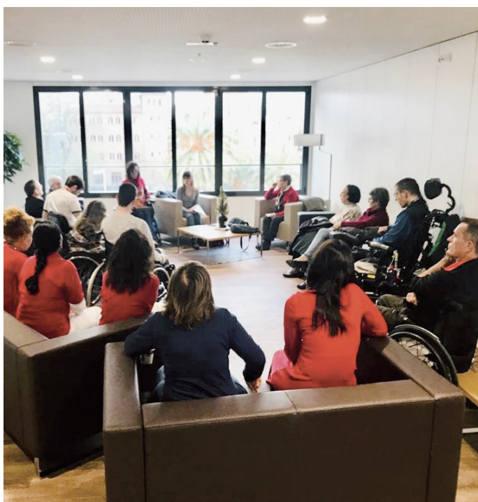
FEBRERO: Presentación del programa de Vida Independiente en Guttman Barcelona Life.