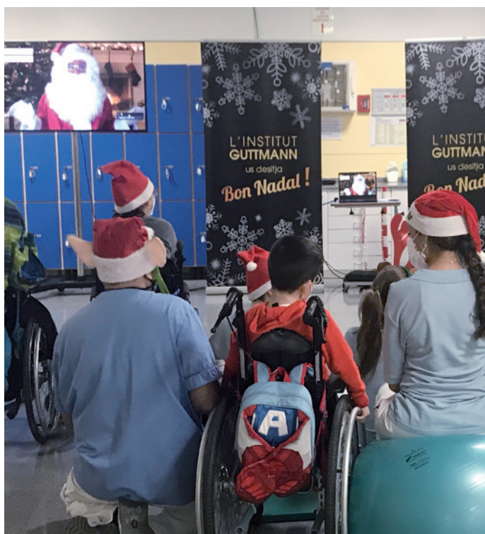
DICIEMBRE: Navidad telemática, un Santa Claus virtual visita a nuestros niños en unas fiestas diferentes y a distancia.